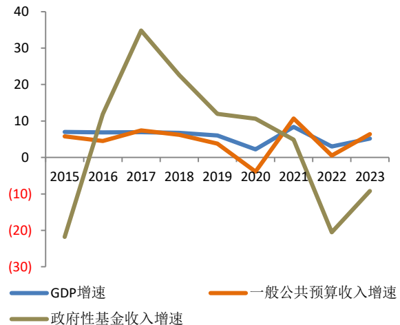
图 2：2015 年以来全国 GDP、一般公共预算收入、政府性基金收入增速（%）